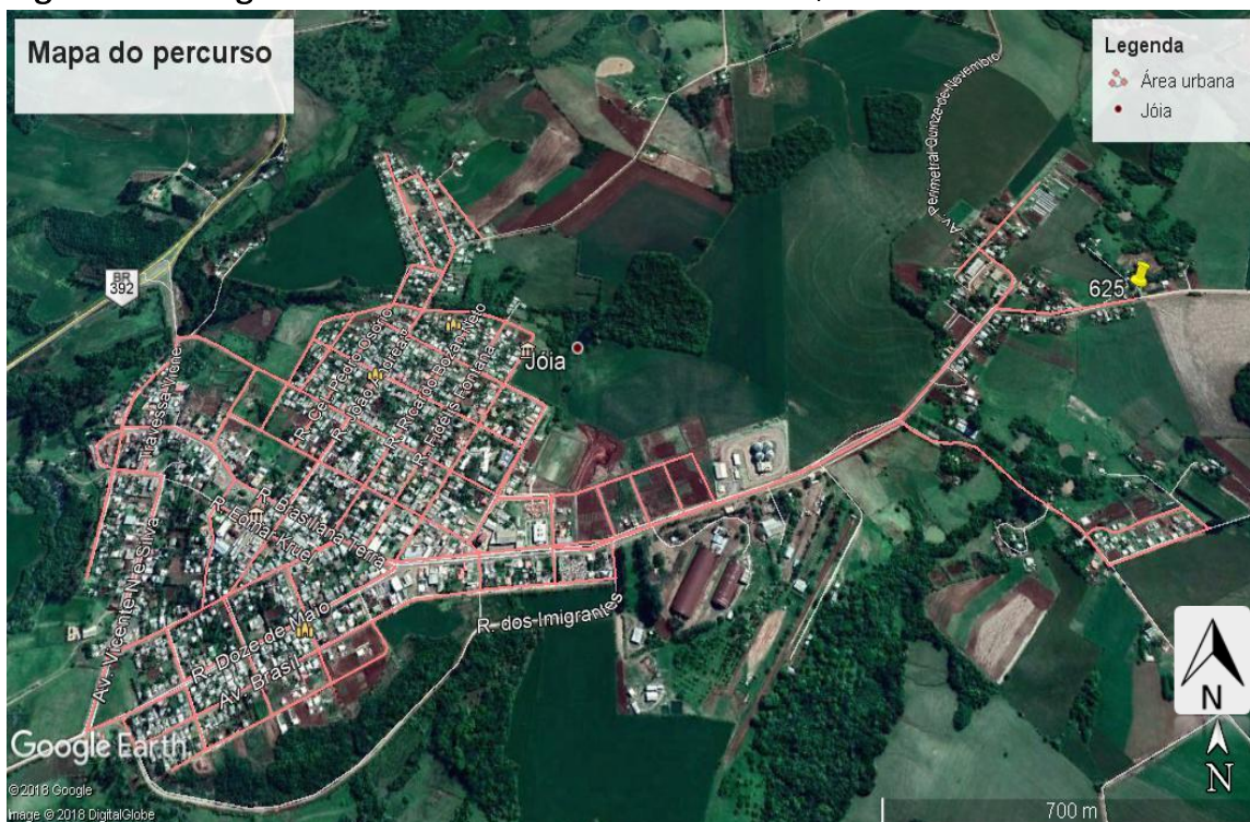
Figura 01 – Imagem de satélite indicando a área urbana, coleta 3 vezes na semana.